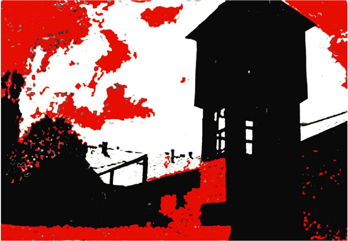
IL GUARDIANO B