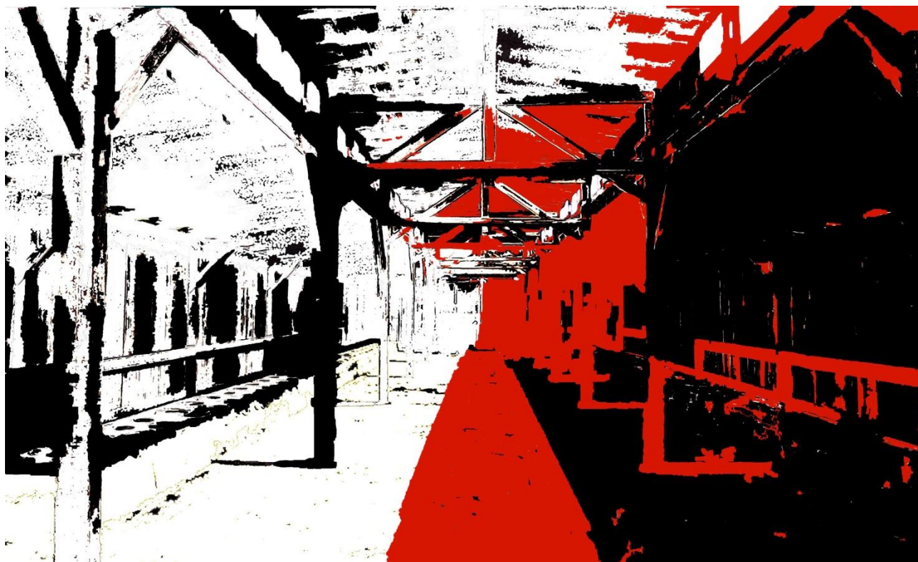
LA CAMERA B