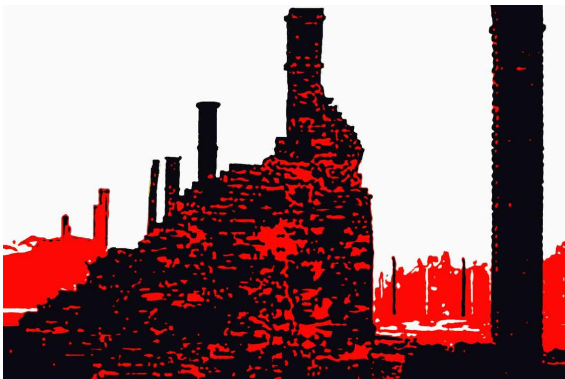
LE CIMINIERE B