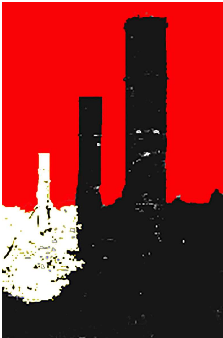
LE CIMINIERE A