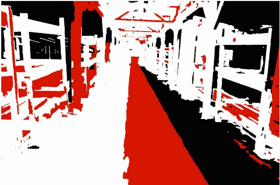
LA CAMERA A