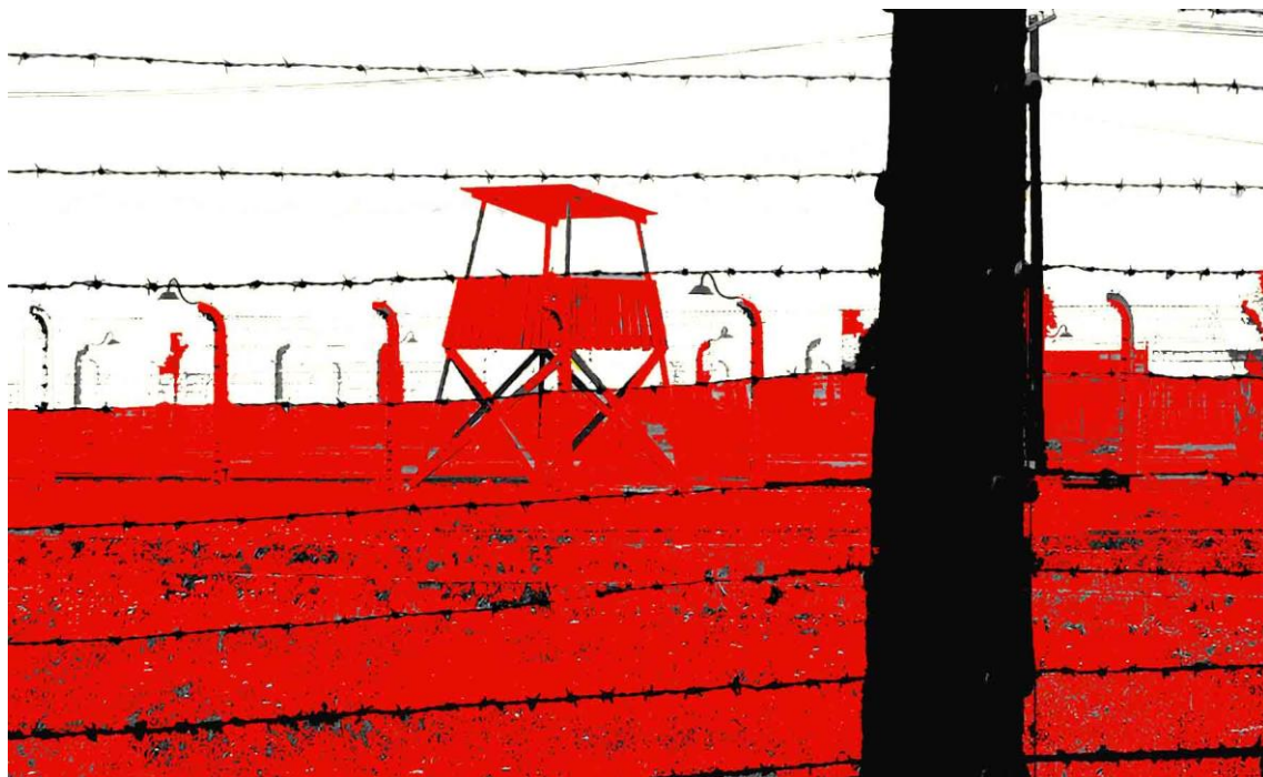
IL GUARDIANO A